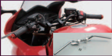
ブラック HBK686B ¥18,700 シルバー HBK686A ¥18,300

ポジション50mmアップ スイッチ穴加工済みでポルトオン ケーブル、ホース類はノーマルのままで取付OK ブレーケット式でトップブリッジは交換不要なので取付簡単 構造変更不要で取付可 ハンドルブレースはSSサイズが適合 ※ハンドル内径φ18mm用サイドキャップが別途必要です。