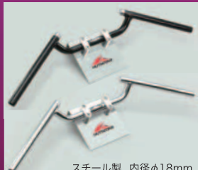
スチール製 内径φ18mm 全巾685mm 全高60mm 絞り角35度 ブラック HB0018B ¥5,800 クロームメッキ HB0018C ¥5,400

従来のコンドルに比べ、絞り角がゆるく、 少しワイドになり、タンクへの干渉が減ります。 全高は少し低くなり、ケーブル類の適合が 若干有利になります。