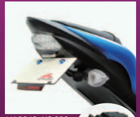
HA6643 ¥8,600 ※リフレクターが別途必要

ベースプレートはアルミ製ブラックアルマイト 明るい高輝度白色LEDライセンスランプ付 専用ハーネス付で接続簡単 ポルトオン ノーマルウインカー対応